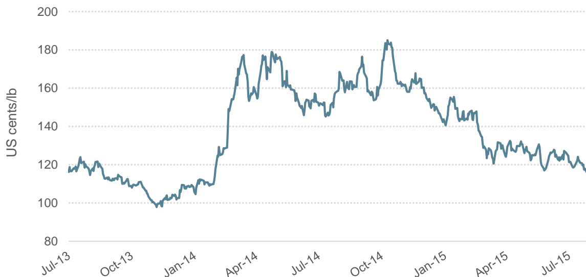
Gráfico1: Precio indicativo compuesto diario de la OIC