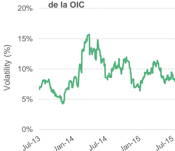
Gráfico 4: Volatilidad en series de 30 días del precio indicativo compuesto de la OIC