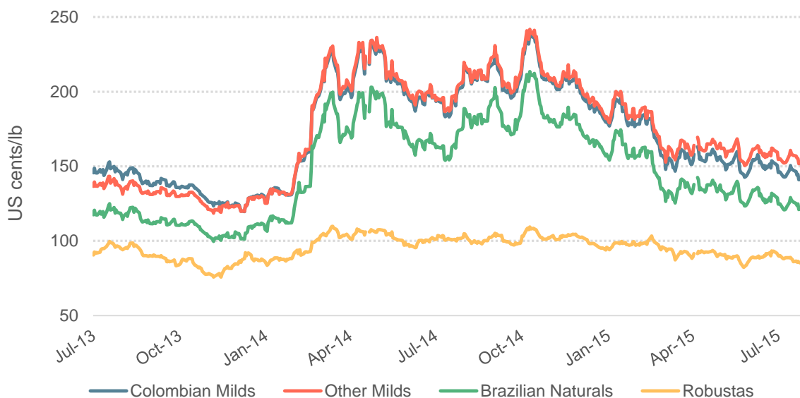
Gráfico 2: Precios indicativos diarios de grupo de la OIC

© 2015 International Coffee Organization ( www.ico.org )