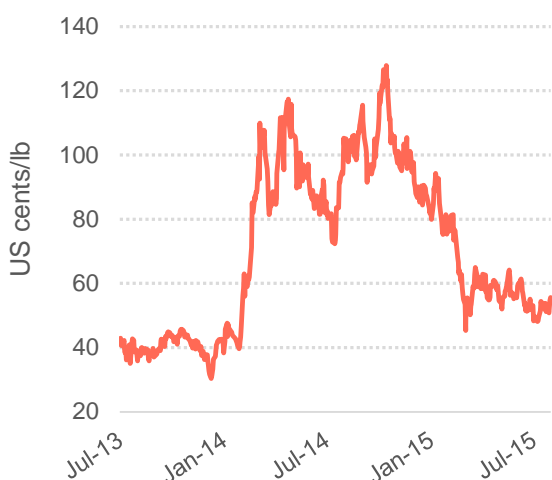
Gráfico 3: Arbitraje entre los mercados de futuros de Nueva York y Londres