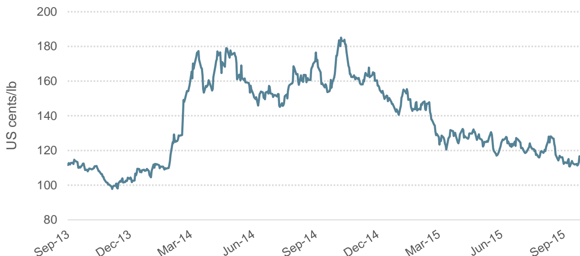
Graphique 1: Prix indicatif composé quotidien de l'OIC