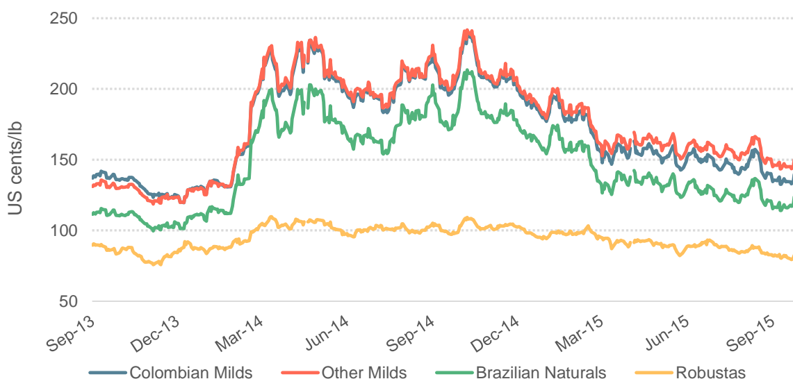
Graphique 2: Prix indicatifs quotidiens des groupes

© 2015 International Coffee Organization ( www.ico.org )