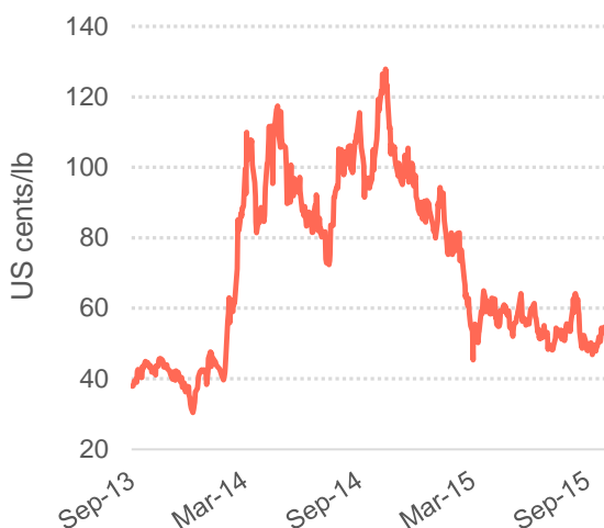
Graphique 3: Arbitrage entre les marchés à terme de New York et de Londres

© 2015 International Coffee Organization ( www.ico.org )