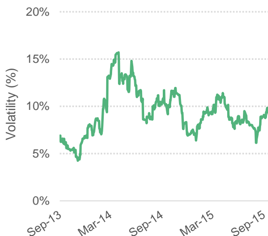
Graphique 4: Volatilité sur 30 jours du prix indicatif composé de l'OIC