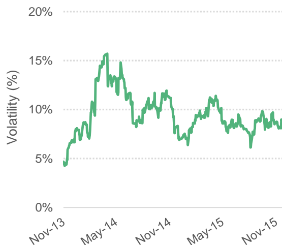
Gráfico 4: Volatilidade da média de 30 dias do preço indicativo composto da OIC

© 2015 International Coffee Organization ( www.ico.org )