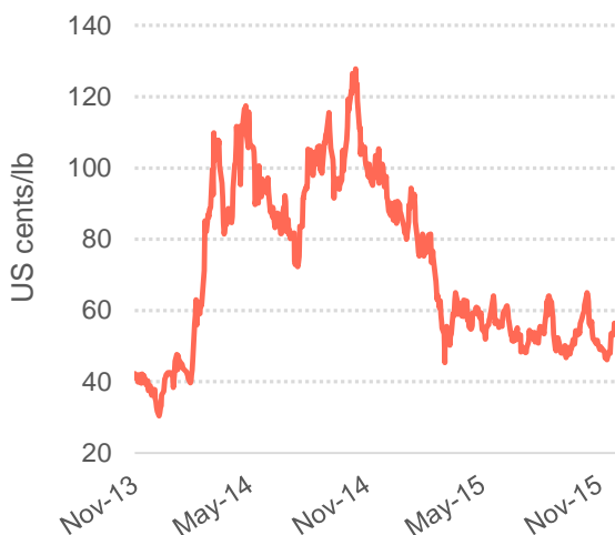
Gráfico 3: Arbitragem entre as bolsas de Nova Iorque e Londres

© 2015 International Coffee Organization ( www.ico.org )