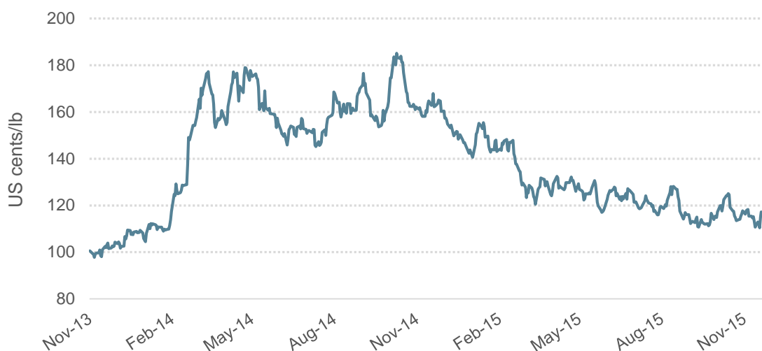
Gráfico 1: Preço indicativo composto diário da OIC

© 2015 International Coffee Organization ( www.ico.org )